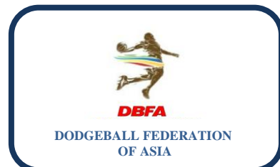
فدراسیون داژبال آسیا (DBFA)