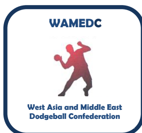
کنفدراسیون داژبال غرب آسیا و خاورمیانه