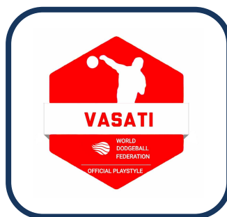
لوگوی داژبال استایل وسطی در جهان